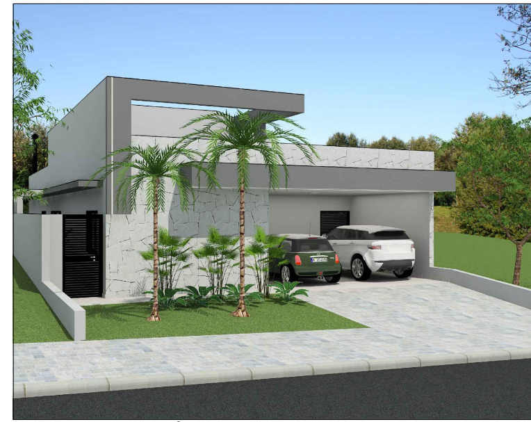
MAQUETE ELETRÔNICA - FACHADA FRONTAL