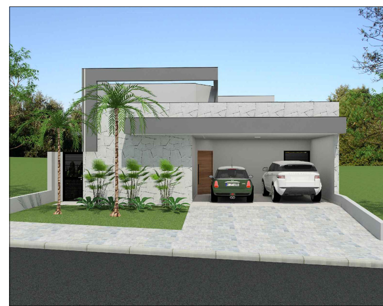
MAQUETE ELETRÔNICA - FACHADA FRONTAL