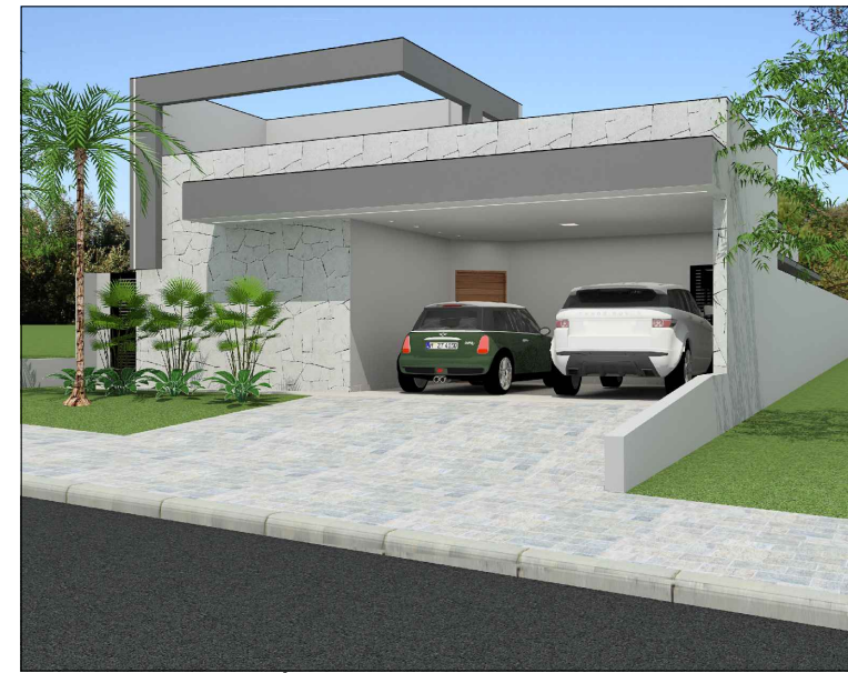
MAQUETE ELETRÔNICA - FACHADA FRONTAL